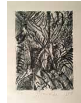
Strafkolonie (zu Volker Braun) 2007 Kaltadelradierung 32,3 x 23,7 cm