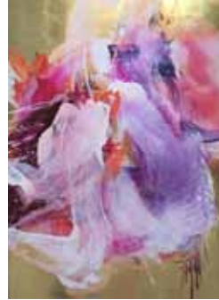
Anatomie der Ekstase 2015 Malerei auf Goldgrund auf Holz 165 x 120 cm

1964 * in Jena lebt und arbeitet in Berlin und Bad Freienwalde