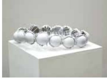
Dekonstruktion eines Traums / Märchens (Detail) Dornenkrone 2016 Akupunkturadeln, Plastikteile, Lack, Acryl 26 x 20 x 6 cm

1977 * in Torgau / Elbe seit 1997 in Berlin