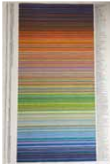
das Jahr 2002 2002 Tusche, Papier 76 x 56 cm

1948 * in Berlin seit 2003 freischaffend in Frankfurt (Oder)