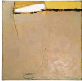
ohne Titel 2000/01 Öl auf Leinwand 60 x 60 cm