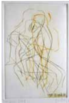
bloss (Blatt 19) 2019 Kaltadelradierung, mehrfach farbig übereinander gedruckt 25 x 16,5 cm

1950 * in Bautzen lebt in Neulewin / Oderbruch