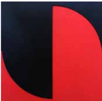
ohne Titel 2019 Bildobjekt 30 x 30 cm

1933 * in Mühlhausen / Thüringen seit 1994 in Sassnitz / Rügen