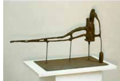
ohne Titel 2019 Eisen 34 x 60 x 24 cm