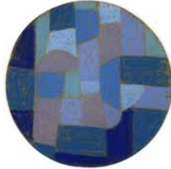
blaue Ferne 1965 Wachsstift auf Papier ø 19 cm

1938 * als in Wriezen seit 1982 in Lietzen / Seelow