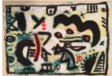
ohne Titel 2018 Mischtechnik auf Papier 29 x 42 cm

1946 * in Pittersdorf / Bayreuth lebt in Marktbreit bei Würzburg