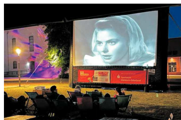
Aufführung im Schlossgut Altlandsberg

Aktuelle Termine finden Sie unter Facebook: Kulturbuero24.de